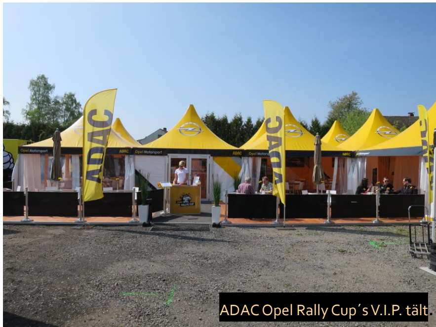
ADAC Opel Rally Cup's V.I.P. tält.