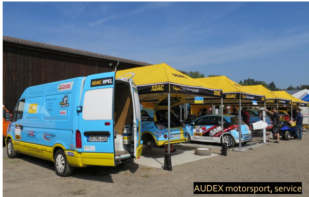
AUDEX motorsport, service