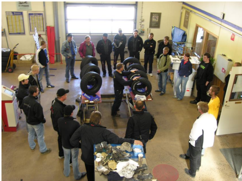
Samling hos Däckproffsen för information om däck.