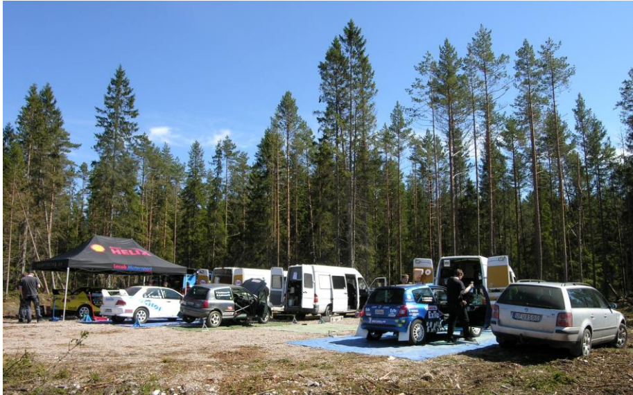
Serviceplats under test och träning